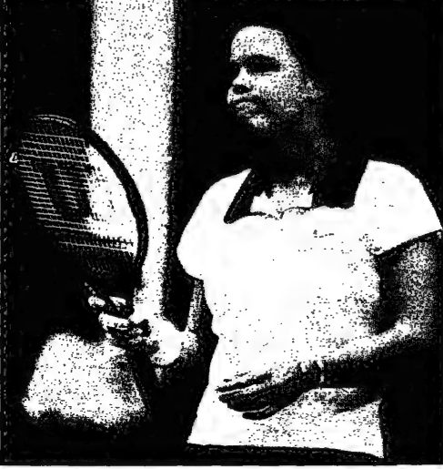
للصلة الاراسي الإسباني ديفينبورت نهزرت